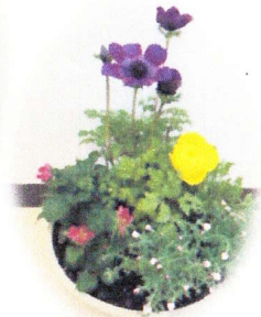
ハンギングバスケット